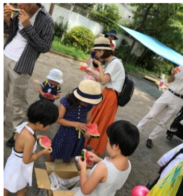
▲スイカで水分補給