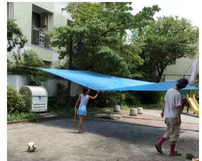
▲タープを張りました