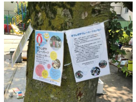
▲パネルを掲示しました