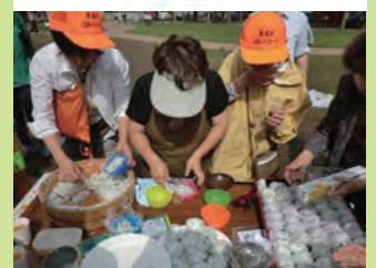
写真・イラスト： 南長崎はらっぱ公園防災マニュアルより