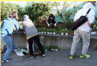
都電への見通しを塞いでいた倉庫は、公園の奥に移動しました。