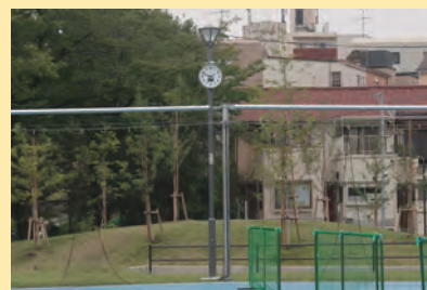
見やすい場所に設置しました