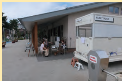
ドリンクやアイスメニューを増やしました