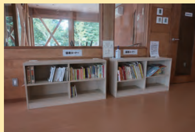
丘の上テラス内に開設しました