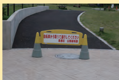
注意標識を設置しました