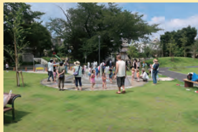
8月末を9月18日まで延長しました