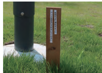
②芝生への立ち入り禁止看板